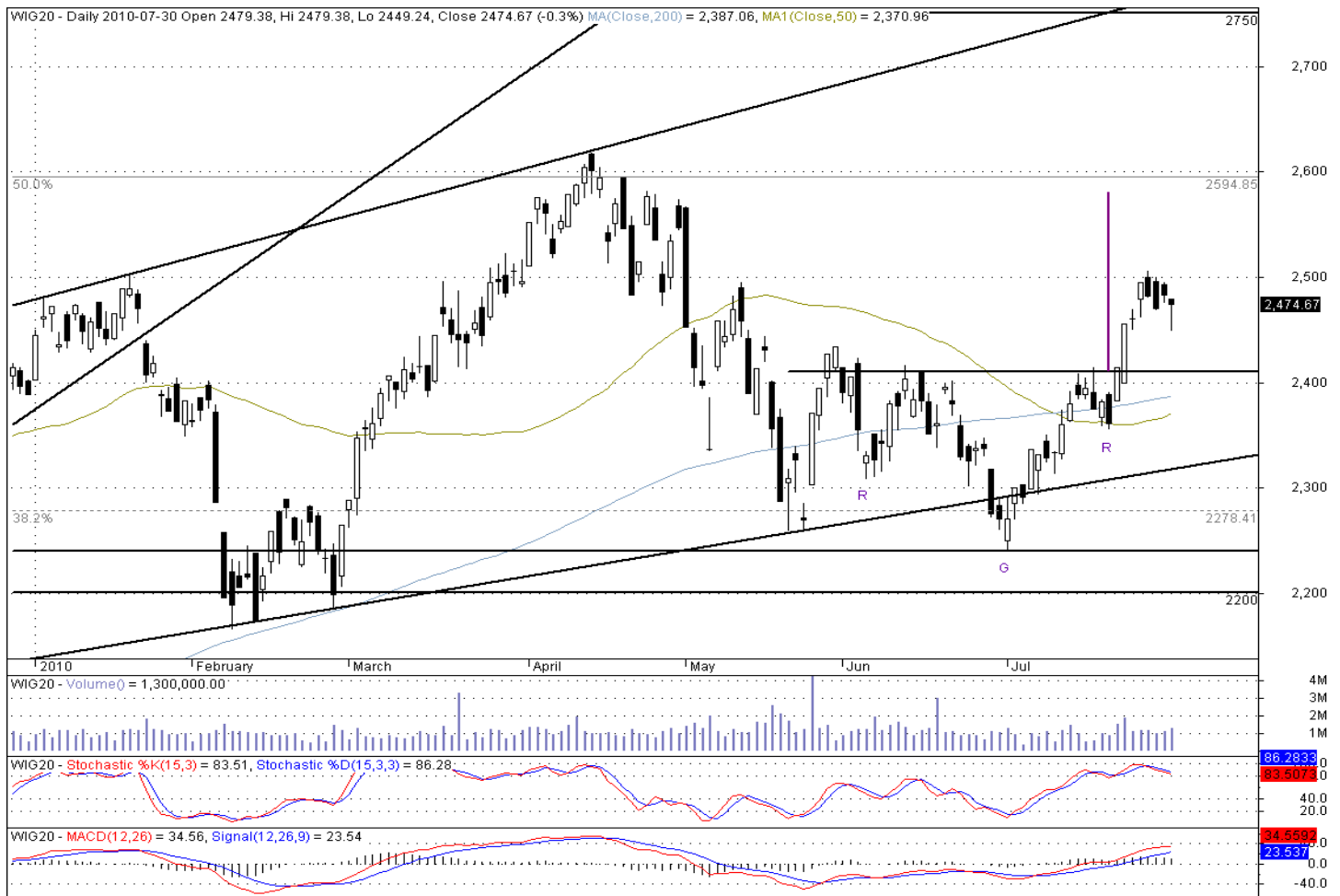
WIG20 – wykres dzienny

Od zakończenia ubiegłego tygodnia kurs indeksu WIG20 wzrósł do 2500 pkt., gdzie napotkał opór. Wydaje nam się, że przebicie tej bariery jest tylko kwestią czasu. W krótkim terminie prawdopodobnie możemy spodziewać się pogłębienia korekty spadkowej, która została już zapoczątkowana. Sprzyja temu wysoki odczyt wskaźnika Stochastik. W nieco szerszej perspektywie jednak wykres indeksu prezentuje się pozytywnie. Silniejszego oporu spodziewamy się w okolicach 2600 punktów, gdzie wyznaczony został szczyt obecnej hossy oraz zasięg odwróconej głowy z ramionami. Pierwszym negatywnym sygnałem byłby ewentualny powrót kursu poniżej poziomu 2400 pkt.